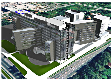
HYPO AAC, Zagreb, 2003. Poslovni kompleks 85000 m 2